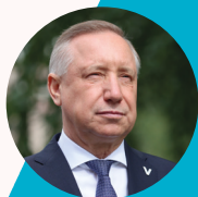
Губернатор Санкт-Петербурга Александр Беглов

— Мы продолжаем повышать уровень поддержки петербургских семей с детьми. Однако, чтобы повысить рождаемость, необходим комплексный подход, включающий улучшение жилищных условий, доступность качественной медицины, возможность обучения и работы для женщин, развитие семейно-ориентированной инфраструктуры. Нам недостаточно только финансово поддерживать семьи. Нужно создавать условия, чтобы люди чувствовали себя уверенно, могли совмещать карьеру и семью.